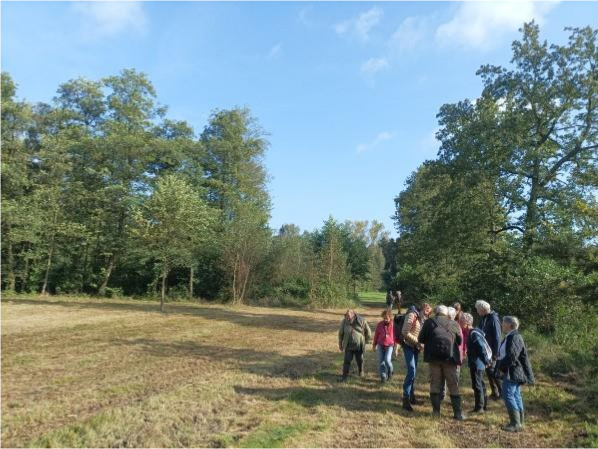
Een flinke groep Slobkousjes